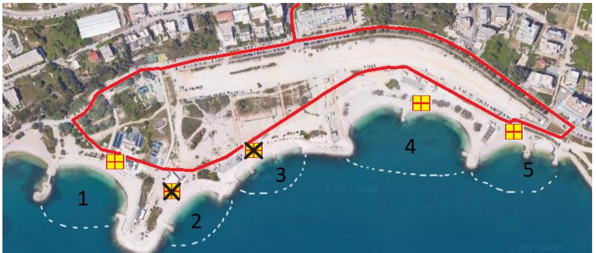
Slika 1. Prikaz nadzornih točaka na gradskoj plaži Žnjan (crnom bojom su prekrizene točke nadzora na kojima spasioci nisu vršili nadzor)

Na Žnjanu su spasioci bili locirani na 3 plaže kao što je prikazano na slici 1.